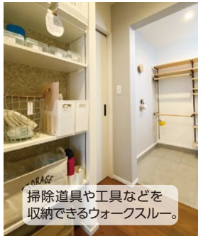
掃除道具や工具などを 収納できるウォークスルー。