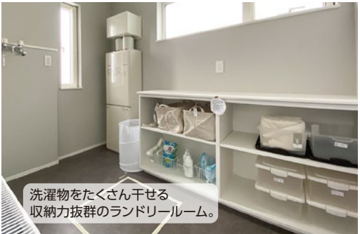
洗濯物をたくさん干せる 収納力抜群のランドリールーム。