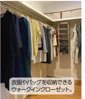
衣服やバッグを収納できる ウォークインクローゼット。