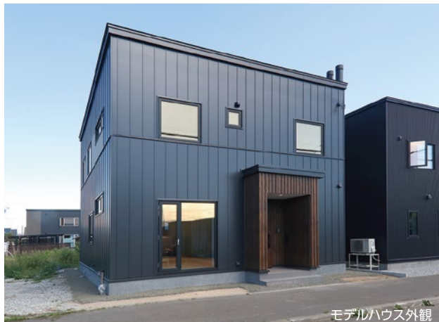
モデルハウス外観

ご成約時にご希望の方に展示家具・家電プレゼント TV・TVボード・ソファ・テーブル・食卓テーブル