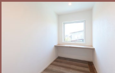
カウンター付フリースペース