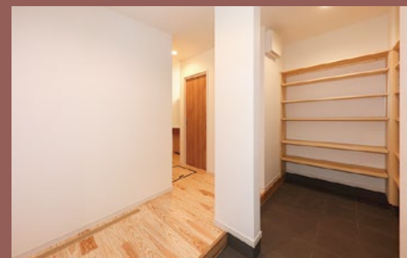
シューズクローゼット