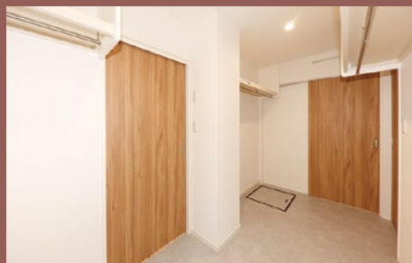
ファミリークローゼット