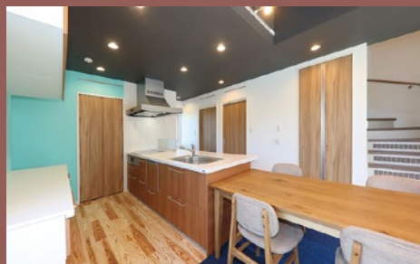
ダイニング・キッチン